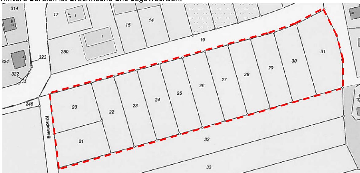
Auszug Liegenschaftskataster 04/2018

Die Umgrenzung des Geltungsbereiches ist dem beigefügten Kartenausschnitt zu entnehmen. Es umfasst die Flurstücke 20 bis 31 der Flur 2, Gemarkung Schönfließ mit einer Größe von ca. 1,12 ha. Die Fläche liegt im Außenbereich sowie im Landschaftsschutzgebiet „Westbarnim“. Der vordere Bereich der Fläche ist als Wiese angelegt und mit zwei Fußballtoren ausgestattet. Der hintere Bereich ist Brachfläche und zugewachsen.